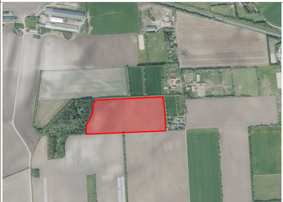
Skovarealet markeret med rødt.