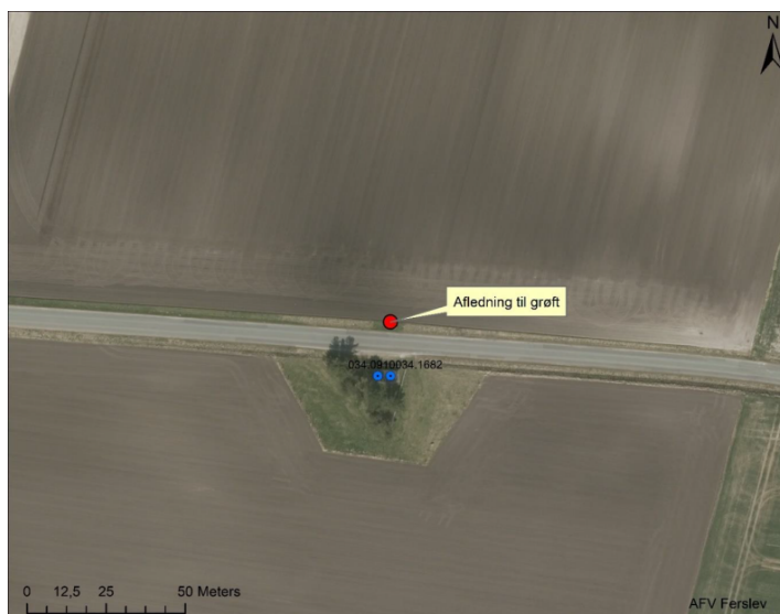
Fig. 1 Placering af boringer (mørkeblå) med udledning til grøft umiddelbart nord for boringer.

På Ferslev Kildeplads er der to indvindingsboringer. Fra boringerne kan vandet via fast skylleledning under Rævedalsvej ledes til udledningsspunkt i nærliggende afvandingsgrøft.