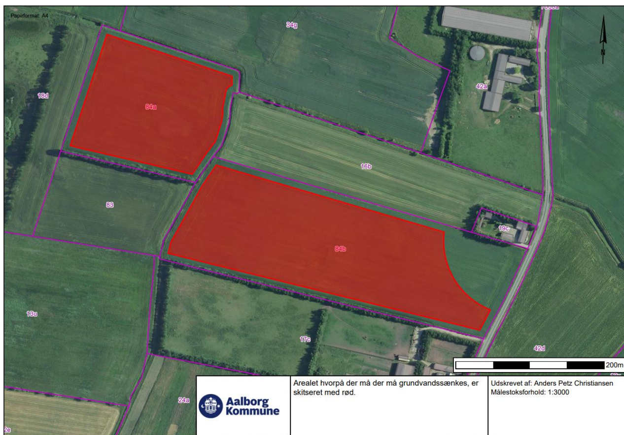
Figur 1. Arealet hvorpå der må grundvandssænkes, er skitseret med rød.

Det skal sikres, at der foreligger en udledningstilladelse inden arbejdet igangsættes. Den oppumpede vandmængde skal måles og data indsendes til Aalborg Kommune jævnfør vilkår i udledningstilladelsen.