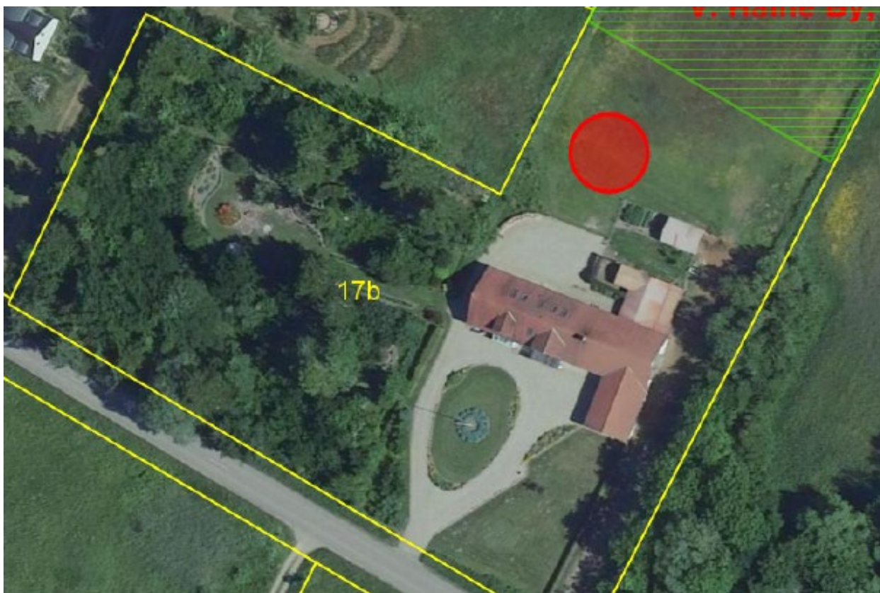
Figur 1: Ortofoto 2024. Oversigt over placering af ansøgte sø.