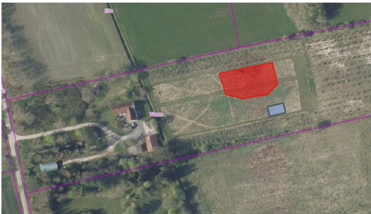
Figur 1: Ortofoto 2024. Placering af ansøgte sø på 1000 m 2 er markeret med rødt og placering af paddeskrab på 50 m 2 er markeret med blå.