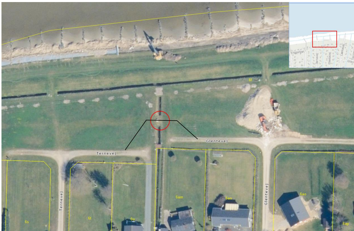
Figur 1: Oversigtskort med placering af eksisterende grøftoverkørsel, som midlertidig udvides (rød cirkel) og interimsvajs omtrentlige placering (sort strek).