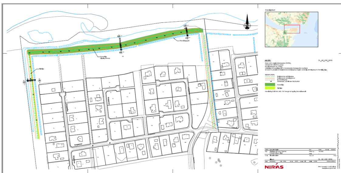
Oversigtskort over digelagets område og diger, som ønskes forstærket.

I medfør af kystbeskyttelseslovens §3a stk.2 er der i tilladelsen inkluderet en dispensation iht. naturbeskyttelseslovens §65 fra lovens §3 til inddragelse af ca. 2800 kvadratmeter beskyttet natur. Endvidere er der i medfør af kystbeskyttelseslovens §3a stk.3 stillet vilkår med hjemmel i vandløbsloven om, at projektet ikke må påvirke vandløb på stedet.