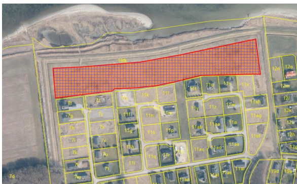
Plejeareal iht. vilkår nr. 8 er markeret med rødt og krydsskravering.