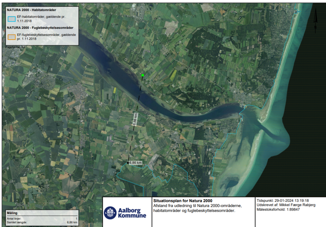
Figur 2: Afstand til nærmeste Natura 2000-område.

Grundet afstanden vurderes udledningen ikke at have negativ indvirkning på de dyr og planter området er udpeget for.