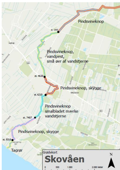
Figur 3. Fra bilag til regulativet. Plantesammensætning i Skovåen 2014-2022.

Aalborg Kommune har udarbejdet et nyt vandløbsregulativ for Skovåen til afløsning af regulativet fra 1997. Med regulativet ændres bestemmelserne for vedligeholdelsen af vandløbet, og der fastsættes dimensioner på strækningen st. 6275-9818 m (udløb), som i det tidligere regulativ fra 1997 var fastlagt som naturstrækning uden dimensioner. Regulativets krav til vandløbets vandføringssevne er beskrevet ved teoretisk skikkelse. Den teoretiske skikkelse på den tidligere naturstrækning fra station 6275 m til udløbet er fastlagt efter de faktiske forhold baseret på opmåling fra 2020. Ligeledes er faldet fra station 7811 m til udløb fastlagt ud fra vandløbets faktiske tilstand.