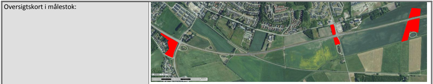
Skovrejsningsområdet markeret med rødt.